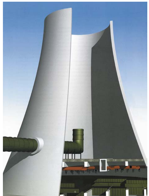
Bild 2: Schema eines Naturzugkühlturms mit Rauchgaseinleitung und vergleichsweise dünner Schale. Höhen bis 200 m sind bekannt.

Im Gegensatz dazu kommt dem Klima bei frei bewitterten Instandsetzungsmaßnahmen immer eine besondere Bedeutung zu. Hierbei sind die Faktoren Sonne, Temperatur, Wind und Regen häufig ko-Kriterien für eine termingerechte Ausführung, und sie sollten deshalb bei jeder sachkundigen Planung berücksichtigt werden.