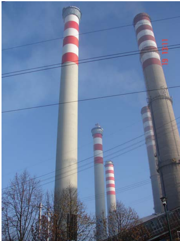
Bild 3: Industrieschornsteine werden im Gleitschalungsbau von einer Nachlaufbühne mit speziellen Beschichtungen nachbehandelt und gleichzeitig geschützt. Höhen über 400 m sind bekannt.

großflächigen Schalenbauwerken wie z. B. Kühltürme und Industrieschornsteine im Kraftwerksbau. Neben den Standardanforderungen werden an solchen Bauwerken immer auch besondere Eigenschaften von Beschichtungen gefordert, die gegen die Einwirkungen aus dem Betrieb der Anlagen dauerhaft beständig sind. Einzelheiten hierzu werden in der zitierten VGB-Richtlinie detailliert beschrieben.